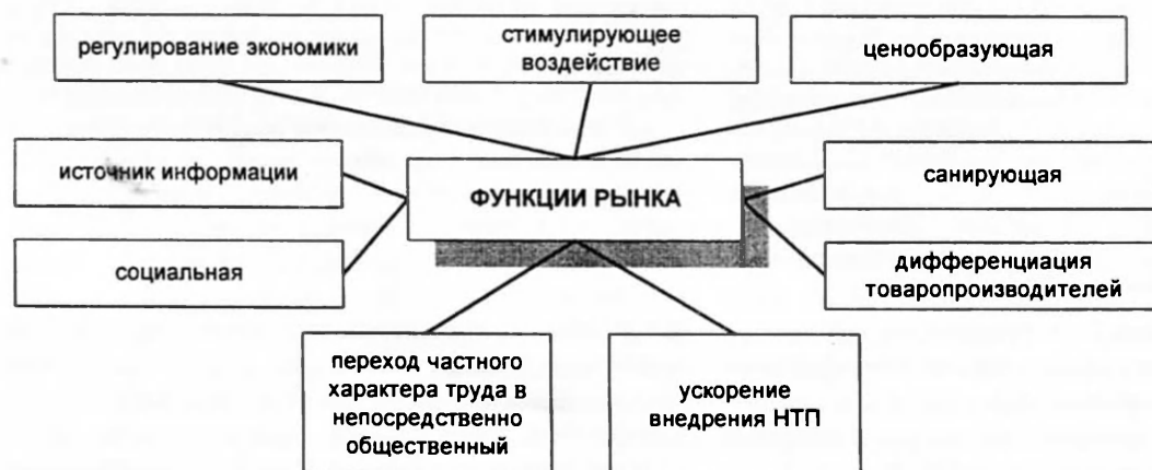
Рис.1. Функции рынка

Под действием спроса и предложения рынок выявляет