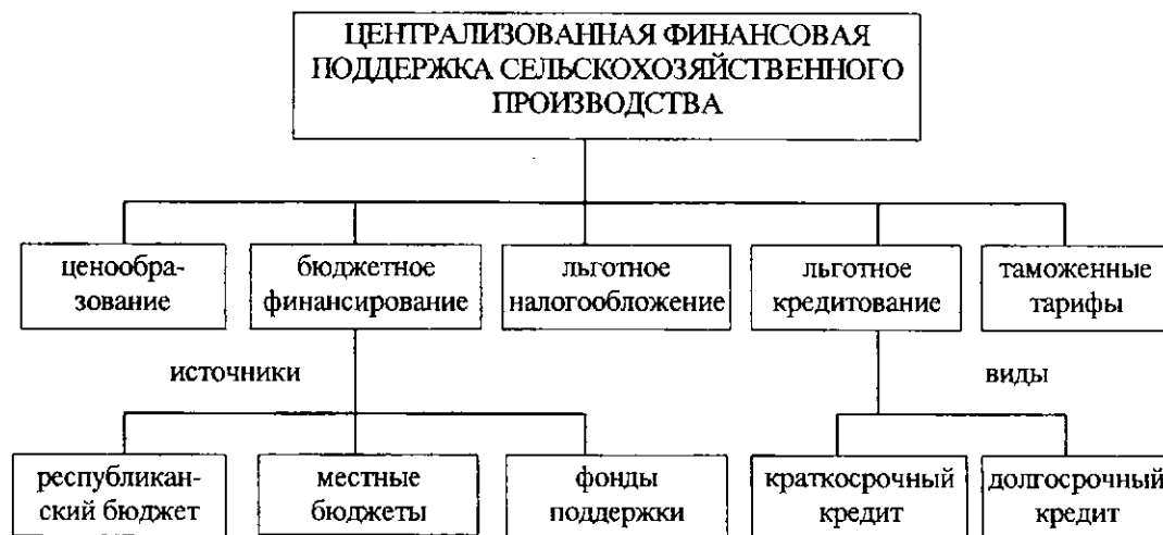
Рис. 1. Централизованная финансовая поддержка сельскохозяйственного производства

производства всегда оказывалась и сельскому хозяйству нашей республики. Государство определяло условия товарно-денежного обмена с сельскими товаропроизводителями, устанавливало уровень цен, активно использовало неценовые методы регулирования — бюджетное финансирование, банковское кредитование, налогообложение, страхование. Посредством этих финансовых рычагов регулировался общий объем денежных ресурсов сельскохозяйственных предприятий. Объем, направления и виды поддержки сельскохозяйственного производства во многом определялись политикой государства, целями и задачами, которые были поставлены перед хозяйствами и отраслью в целом на каждом конкретном этапе развития, а также экономическими возможностями государства. Государство на макроуровне определяет порядок и объемы закупок сельскохозяйственной продукции для государственных нужд, минимальные закупочные цены, условия финансирования и кредитования. От государственной политики по отношению к сельскому хозяйству во многом зависят итоги его работы.