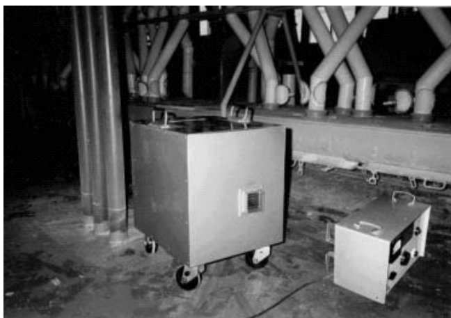
Рис. 1. Озонатор ЭРГО с пультом управления в мукомольном отделении ОАО «Лидахлебопродукт» во время дезинсекции

Несомненным преимуществом разработанной технологии является отсутствие необходимости остановки производства на длительный период, при котором предприятия несут убытки. Для новой технологии проведение предварительных подготовительных работ заключается