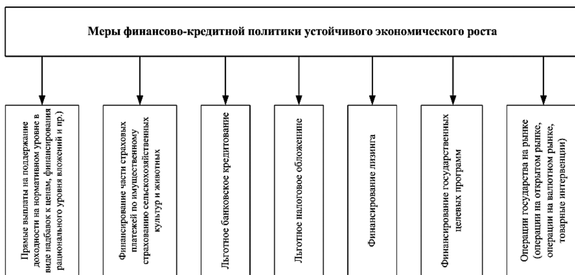
Рис. 4. Меры финансово-кредитной политики устойчивого экономического роста сельскохозяйственных организаций

Важной особенностью сельской социальной инфраструктуры является то, что ее отрасли не могут заменять друг друга. Например, если в сельском населенном пункте высоко востребованы образовательные услуги, то недостаток объектов данной отрасли социальной инфраструктуры может послужить стимулом к перемене места жительства.