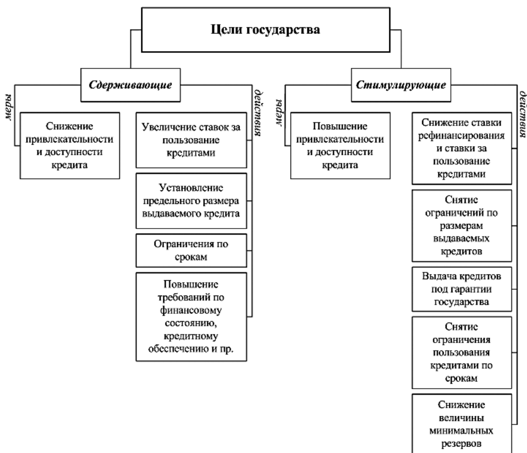
Рис. 3. Направления кредитной политики государства, обеспечивающие инновационное развитие сельских организаций и предприятий

При помощи системы кредитования возможно сдерживание либо стимулирование отраслей, это может относиться как к отдельно взятой отрасли, предприятию, так и в целом к экономике государства (рис. 3).