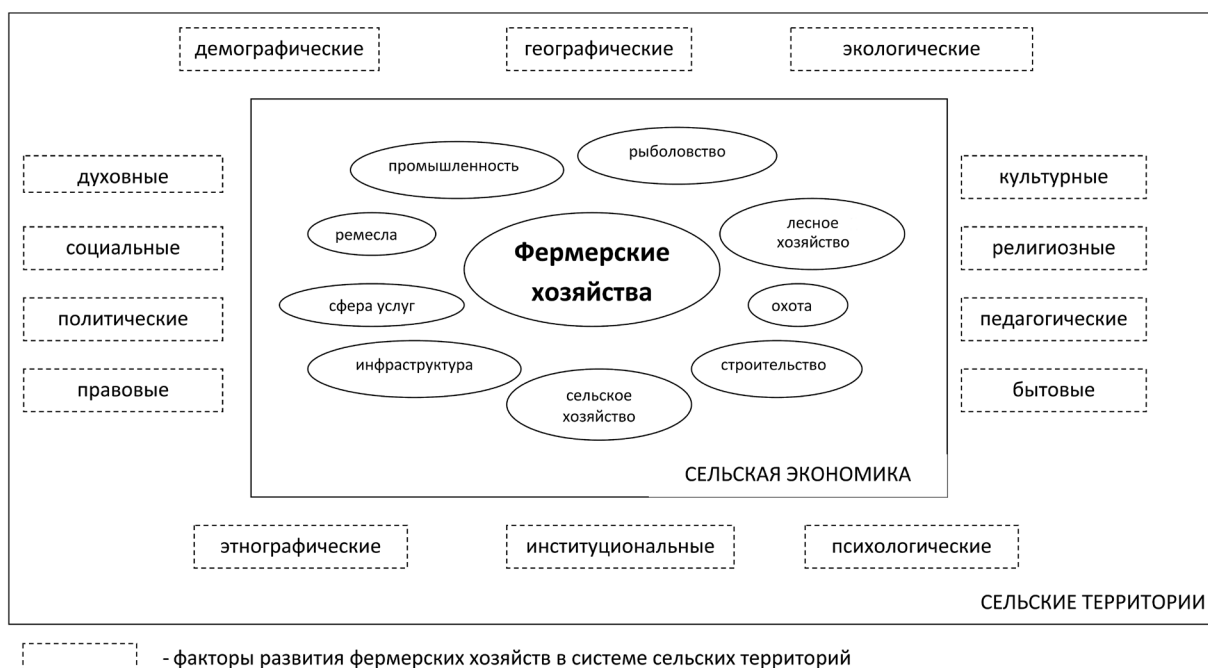
Рис. 1. Системная модель «Фермерские хозяйства – сельская экономика – сельские территории»

Как видим, на развитие фермерских хозяйств оказывает влияние множество факторов. К системообразующим целесообразно отнести организационно-экономические и социально-психологические факторы, поскольку именно они в большей мере обеспечивают успешность создания и функционирования фермерских хозяйств.