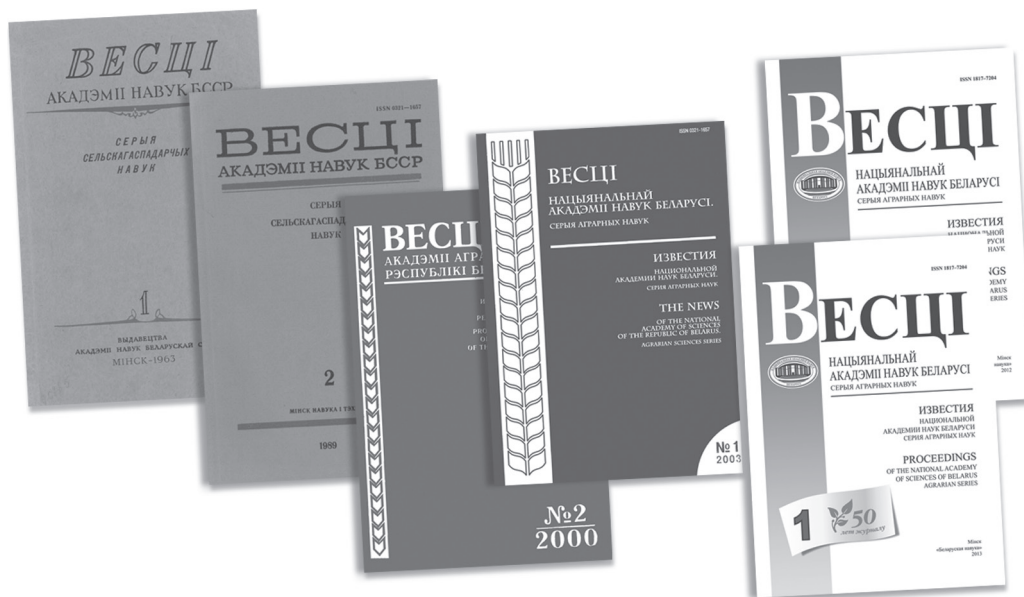
Художественное оформление журнала «Вестці Нацыянальнай акадэміі навук Беларусі. Серыя аграрных навук»

нуты, поскольку поставленные задачи не получили должного материального и финансового обеспечения. В стране стали нарастать кризисные явления, усиливаться механизмы торможения. Объявленная перестройка и ускорение экономики не давали желаемых результатов. Усиливались противоречия между отраслями, нарастали явления межотраслевого ценового непаритета. Журнал «Вестці Нацыянальнай акадэміі навук Беларусі. Серыя аграрных навук» выступил с рядом публикаций ведущих ученых по стабилизации экономической ситуации, налаживанию нормальной хозяйственной деятельности, восстановлению приоритета АПК в структуре отраслей экономики.