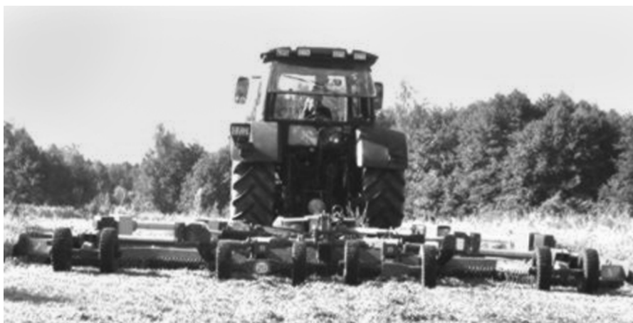
Рис. 4. Косилка для ухода за лугопастбищными угодьями КП-6,2