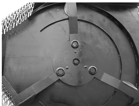
Рис. 5. Трехножевой ротор косилки КП-6,2

Заключение. На основе теоретических исследований получены зависимости, связывающие конструктивные параметры рабочих органов (режущей части ножа, подъемной пластинки) косилки с кинематикой процесса резания. Полученные результаты позволяют реализовать программное проектирование параметров режущей части ножа. Теоретические предпосылки подтверждены результатами экспериментальных исследований. Так, для косилок с шириной захвата 6,2 м конструктивные параметры рабочих органов, обеспечивающие соблюдение функциональных показателей качества выполнения технологического процесса, должны быть следующие: ширина пластины ножа – 162 мм, высота подъемной пластинки – 48 мм, угол заострения режущей кромки – 35°, задний угол режущей части – 5°, угол наклона рабочей поверхности подъемной пластинки – 40°, толщина ножа – 12 мм.