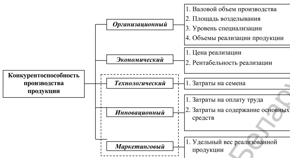
Рис. 2. Факторы для определения конкурентоспособности производства продукции картофелеводства (составлено по результатам факторного анализа)

На втором этапе нами выполнен кластерный анализ тех же объектов (312 предприятий) исследования с применением указанных признаков, что позволяет провести их классификацию в относительно однородные группы, называемые кластерами. Объекты в каждом кластере должны быть похожи друг на друга в большей степени, чем на объекты других классов, и отличаться от объектов других кластеров сильнее, чем от объектов собственного класса.