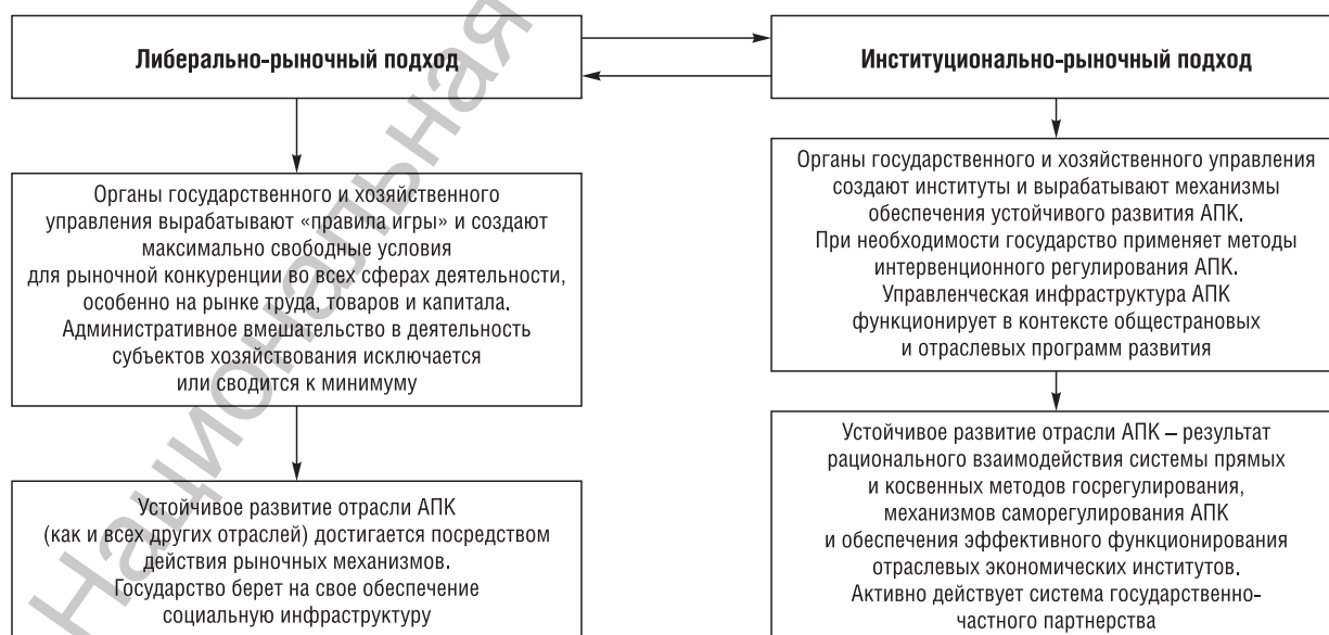
Рис. 3. Содержание либерально-рыночного и институционально-рыночного подходов оценки результативности и повышения эффективности АПК

Следует сказать, что либерально-рыночный подход к функционированию сложных экономических систем, в том числе отраслевого характера, сформировался в XIX–XX вв. Анализ показывает, что его использование результативно в условиях стабильно развивающихся экономических