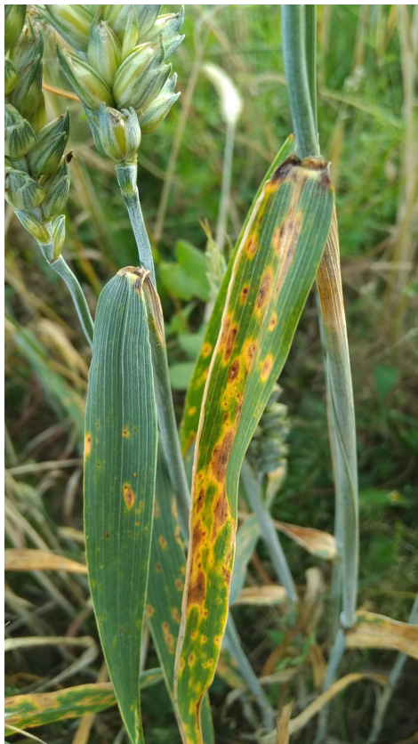
Рис. 1. Симптомы поражения листьев озимой пшеницы возбудителем Pyrenophora tritici-repentis , опытное поле лаборатории иммунитета Научно-практического центра Национальной академии наук по земледелию, 2016 г.

Fig. 1. Symptoms of winter wheat leaf damage by causative agent, experimental field of the immunity laboratory of Research and Practical Center of the National Academy of Sciences of Belarus for Arable Farming, 2016