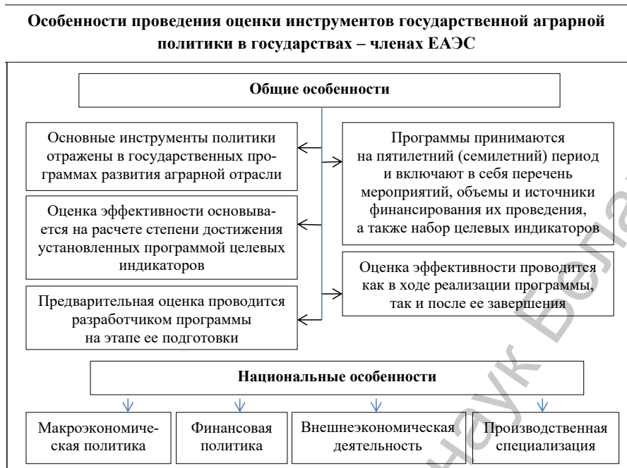
Рис. 2. Национальные особенности проведения оценки инструментов государственной аграрной политики в государствах – членах ЕАЭС