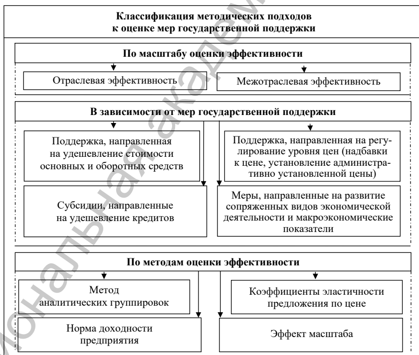
Рис. 3. Классификация методических подходов к оценке мер государственной поддержки (авторский подход)