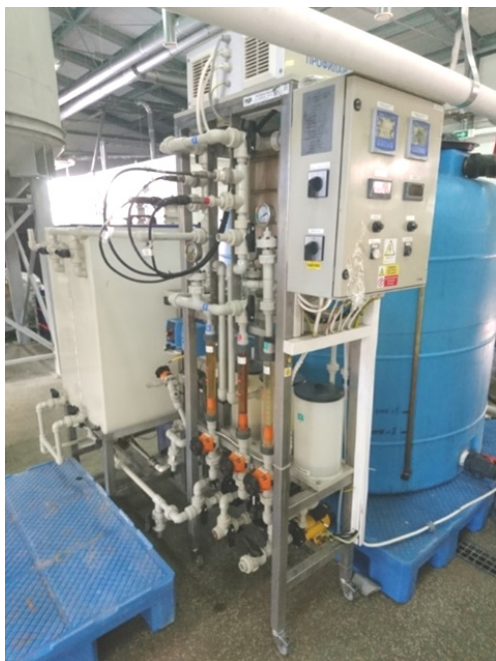
Рис. 1. Пилотная электродиализная установка ED(R)-Y

Материалы и методы исследований. При выполнении работы использовались современные методы постановки эксперимента, теоретический анализ, аналитические и физико-химические исследования полупродуктов сахарного производства и мелассы.