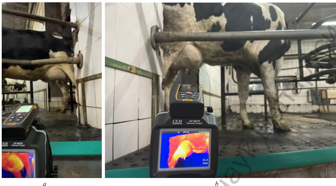
Рис. 2. Размещение средства для бесконтактной идентификации мастита коров в условиях поточного производства молока на доильной установке «Параллель»: правое движение коров в доильный бокс для доения (а); левое движение коров в доильный бокс для доения (b)

Fig. 2. Placement of a tool for contactless identification of cow mastitis in conditions of flow-line milk production on the Parallel milking parlor: right movement of cows into the milking box for milking (a); left movement of cows into the milking box for milking