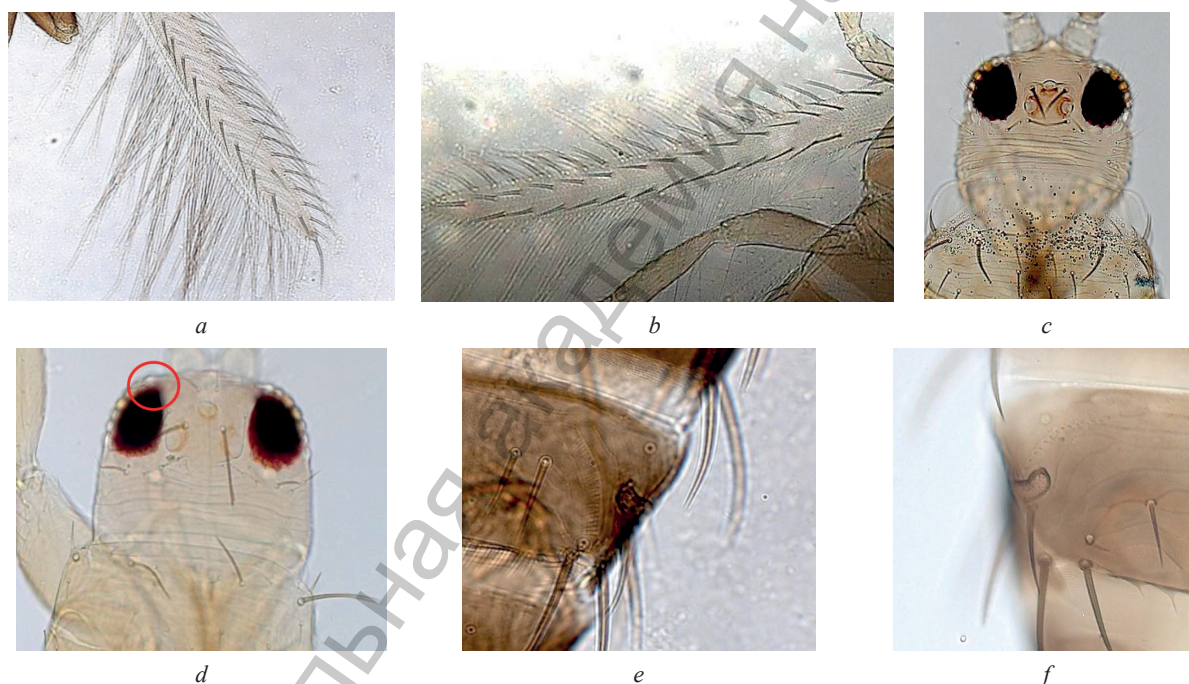
Рис. 1. Ключевые отличительные признаки трипсов – представителей Thrips sp. и Frankliniella sp.: а – переднее крыло имаго Thrips sp. с прерывистым рядом первой жилки щетинок; б – переднее крыло имаго Frankliniella sp. с полным рядом первой жилки щетинок; в – голова имаго Thrips sp. с двумя парами оцеллярных щетинок; д – голова имаго Frankliniella sp. с дополнительной парой оцеллярных щетинок; е – расположение дыхальца внутри ктенидии на VIII брюшном тергите Thrips sp.; ф – расположение дыхальца снаружи ктенидии на VIII брюшном тергите Frankliniella sp.

Экземпляры, которые можно идентифицировать как Thrips sp., имеют прерывистый ряд щетинок на передней жилке передних крыльев, в то время как у особей Frankliniella sp. присутствует два полноценных ряда. Различия заключаются и в количестве оцеллярных щетинок на голове (2 пары – Thrips sp.; 3 пары – Frankliniella sp.), а также в расположении дыхалец относительно ктенидий на VIII брюшном тергите: внутри ктенидий – Thrips sp.; снаружи ктенидий – Frankliniella sp. [23] (рис. 1).